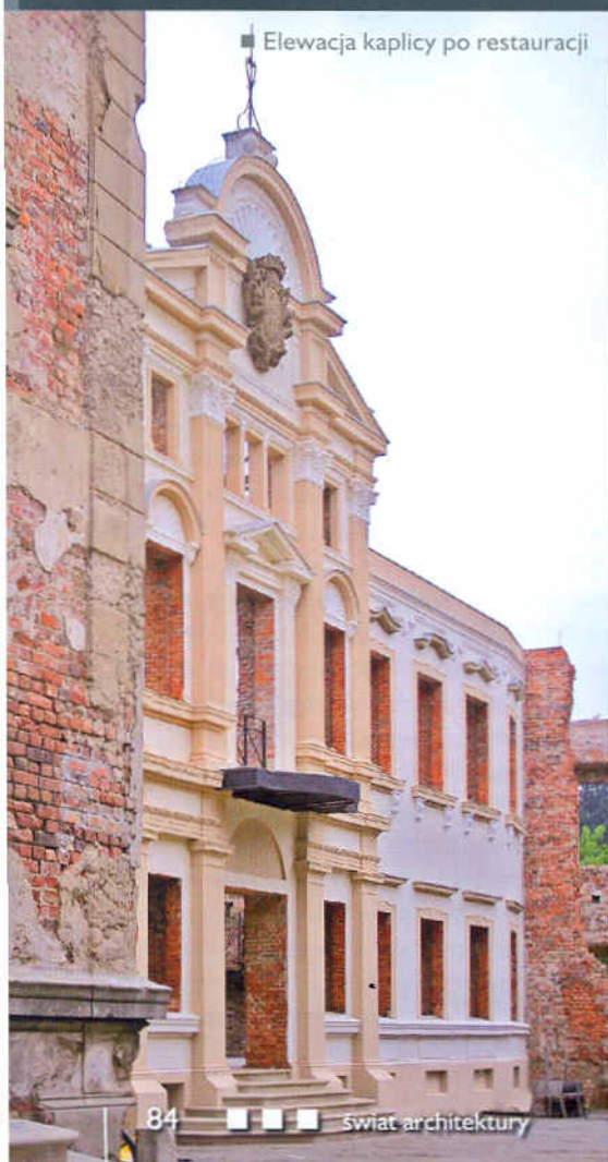
■ Elewacja kaplicy po restauracji

Prace zakończono w 2008 r. Obecnie w baszcie działa punkt informacji turystycznej, a zamek stanowi doskonałą scenę dla wydarzeń kulturalnych, takich jak koncerty czy plenerowe przedstawienia teatralne. W ruinach prowadzona jest działalność gastronomiczna, dla gości udostępniono także taras widokowy.