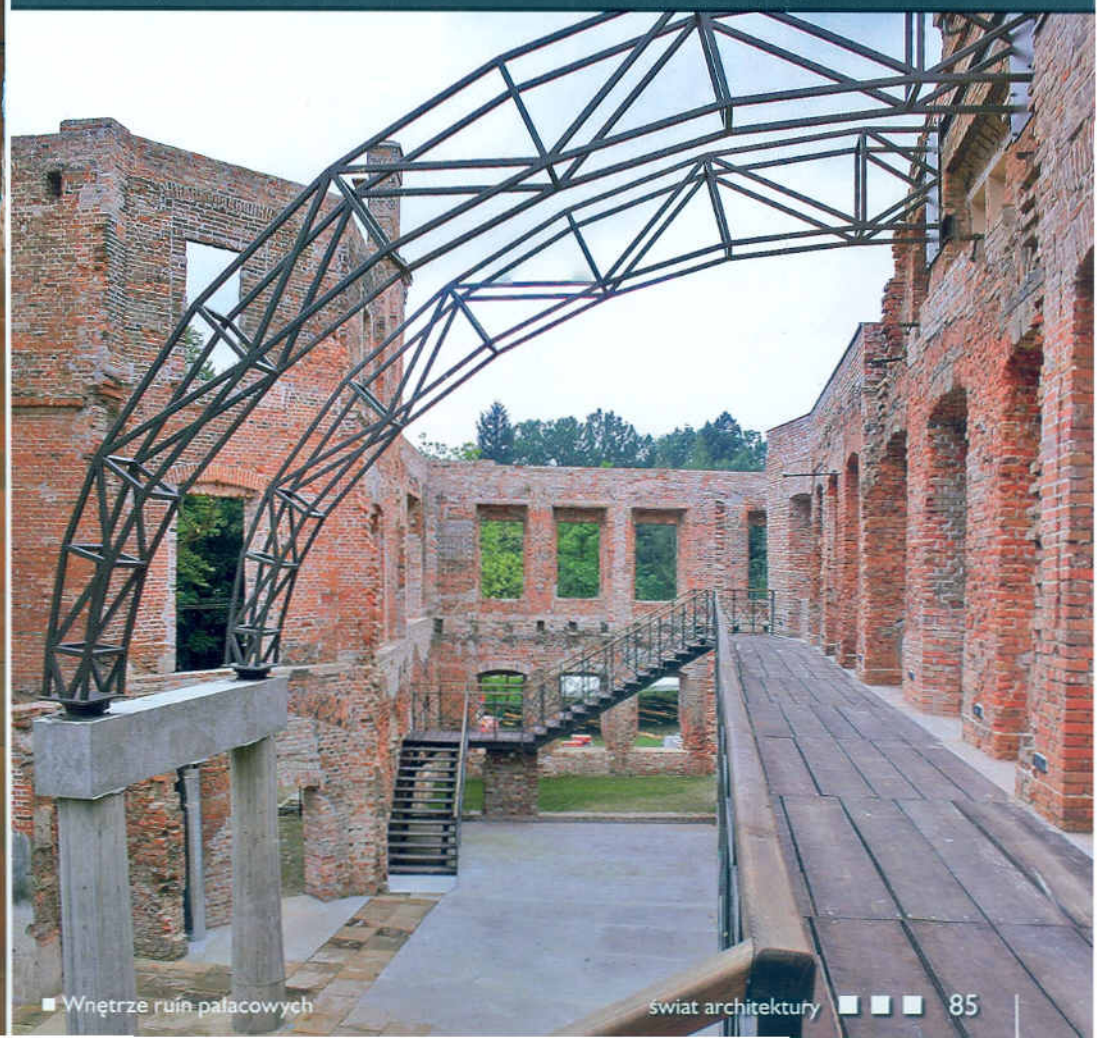
■ Wnętrze ruin pałacowych

ma na celu wyłonienie najlepszych projektów zrealizowanych przy współfinansowaniu z Funduszy Europejskich, które przyczyniają się do podniesienia atrakcyjności turystycznej i kulturalnej Polski.