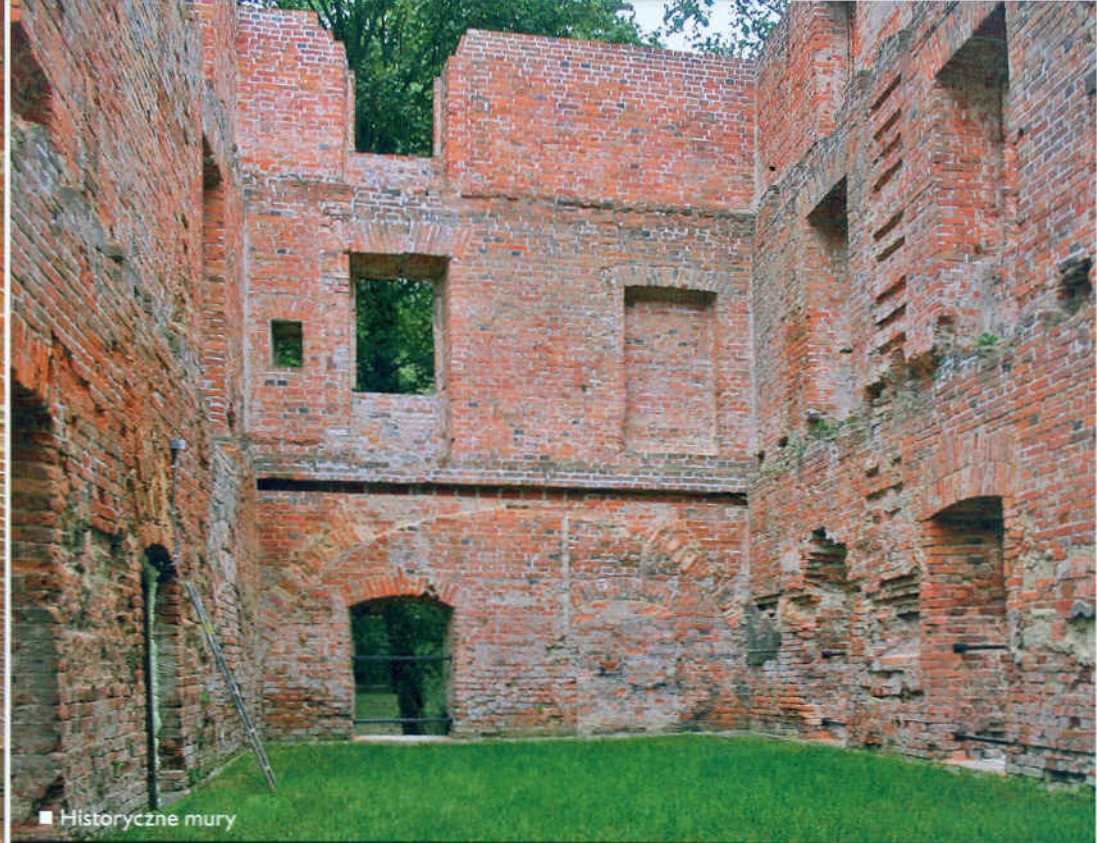
■ Historyczne mury

W tym roku projekt został nominowany do nagrody głównej III edycji konkursu organizowanego przez Ministerstwo Rozwoju Regionalnego „Polska pięknieje – 7 cudów Funduszy Europejskich”, w kategorii zabytek. Konkurs